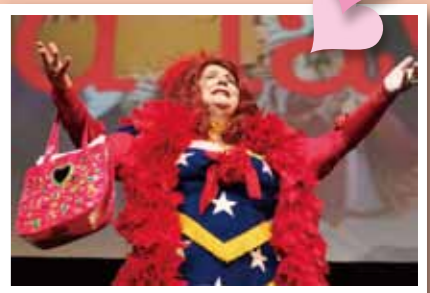
セックスワークという言葉を提唱したキャロル・レイ